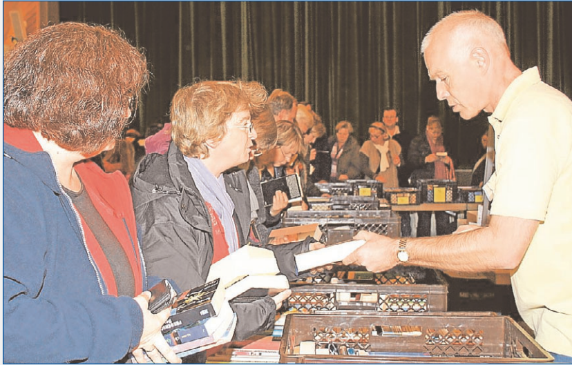
Bücherkisten ohne Ende, rund 7000 Romane, Sachbücher, Reiseberichte, Kochbücher und noch viel mehr gab es beim fünften Büchertag in Schortens.

Die „Vegetarische Küche leicht gemacht“ sorgte am Sonntagnachmittag im Bürgerhaus Schortens spontan für Diskussionsstoff. Was als Anregung für das eine oder andere Familienmahl gedacht war, rief beim Ehemann nämlich spontan einen mehr als skeptischen Blick hervor. Ob das Paar sich nun für das bunt und durchaus appetitanregend bebilderte Werk entschied oder doch lieber zu „Grillspezialitäten für alle Fälle“ griff oder zu einem der anderen Kochbücher, wurde vorerst nicht geklärt. Die Qual der Wahl war nämlich überaus groß beim fünften Büchertag, den der Lions-Club Schortens wieder im Bürgerhaus Schortens veranstaltete. Der Büchertag unter dem Motto „Lust am Lesen“ Anfang November ist mittlerweile zu einer sehr beliebten Tradition geworden. Und zwar auf beiden Seiten, bei den Buch-Spendern und bei den Buch-Käufern. „Hier gebe ich