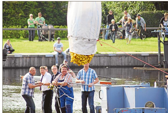
Offenbar nicht raus aus dem Sack wollten die Quietsche-Entchen. Mit einem Hau-Ruck ließ sich der Sack am Ende doch öffnen und gab die kleinen Nesthocker frei.