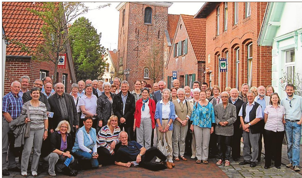
Lektoren aus vielen Gebieten des Sprengels Ostfriesland trafen sich jetzt im geschichtsträchtigen Neustadtgödens.